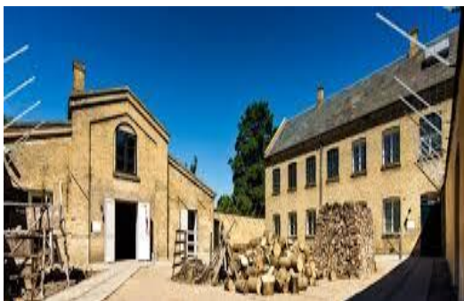
Fattiggårdsmuseet i Svendborg

Møderne i 2015 vil have et samlet tema, nemlig "de fattige". Hvordan var det at være fattig i slutningen af 1700-tallet, og hvordan var forsorgen for de fattige. Forårets studiekreds sluttes af med en