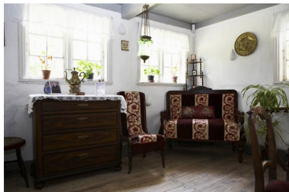
Den fine stue på Museumsgården i Keldbylille

Kontingentet er kun 100 kr. pr. personligt medlem og 200 kr. pr. husstand. For dette beløb får du - udover at støtte det gode formål med at bevare Køng Museum - også gratis adgang til Museet i Vordingborg, Empiregården i Stege og Museumsgården i Keldbylille.