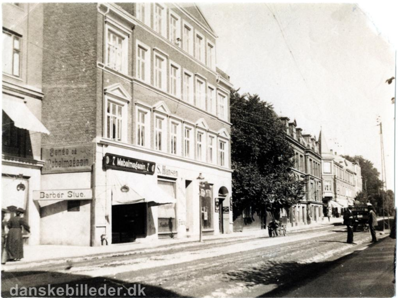
Rolighedsvej 5-9, ca. 1900.